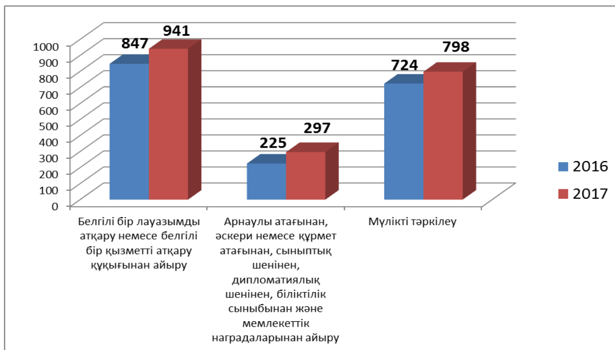
2 Сурет. 2016-2017 жылдардағы сыбайлас жемқорлық қылмыстары бойынша тағайындалған қосымша жазалар саны.

Сонымен қатар, кей жағдайларда, сот тәжірибесінде қосымша жазалар жаза тағайындаудың жалпы бастаулары мен мақсатына сай тағайындалмай жататын фактілері кездесіп отырады.